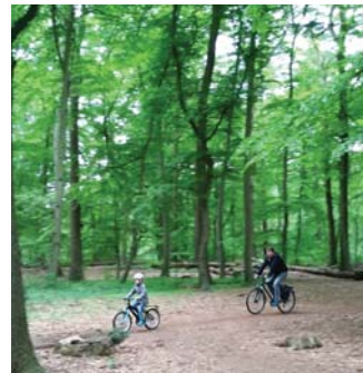
Papa und Kind unterwegs

Getreu meinem Motto „Ich schau auf die Welt wie sie mir gefällt“ bin ich total begeistert von Fahrradlerngeschichten. Meine Enkelkinder haben mit ihren Eltern und Unterstützung der Großeltern das Fahrradfahren gelernt. Sie erobern damit ihre Welt, fahren zur KiTa und zur Schule, sind unglaublich stolz auf ihre Fähigkeiten und entwickeln ein Selbstbewusstsein, das für ihren weiteren Lebensweg ein gutes Startkapital ist.