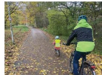
Opa und Kind unterwegs

Bei meinen Aktivitäten als ADFC Tourenleiter zeige ich den Teilnehmenden meinen Spaß am Fahrradfahren. Sie lernen Oldenburg und die Umgebung kennen, können sich frei von der Notwendigkeit zur Navigation ganz auf die Umgebung und die Mitfahrenden konzentrieren, bewältigen körperliche Herausforderungen und bekommen dadurch ganz nebenbei einen wohltuenden Abstand von beruflichen und privaten Anforderungen.